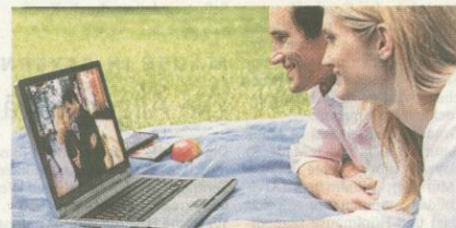
Noch freuen sich die beiden über die schönen Fotos im Internet...